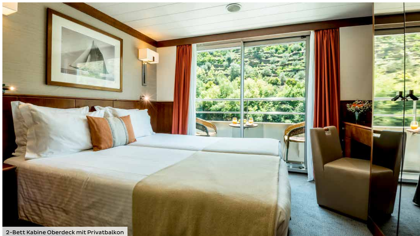
2-Bett Kabine Oberdeck mit Privatbalkon

Willkommen an Bord von MS DOURO QUEEN. Hier sind beste Aussichten garantiert! Entspannen Sie auf dem Sonnendeck und genießen Sie die herrliche Landschaft des Dourotals mit ihren Weinterrassen. Der Swimmingpool an Deck lädt zwischendurch zu einer erfrischenden Abkühlung ein. Komfort wird an Bord groß geschrieben. Die stilvoll eingerichteten Kabinen verfügen im Oberdeck über einen Privatbalkon mit Sitzmöglichkeiten. Im gemütlichen Restaurant genießen Sie eine hervorragende landestypische und internationale Küche sowie die edlen Tropfen der weltberühmten Weinregion.