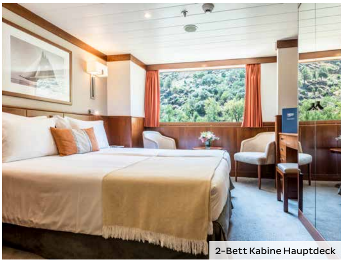
2-Bett Kabine Hauptdeck