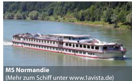
MS Normandie (Mehr zum Schiff unter www.1avista.de )