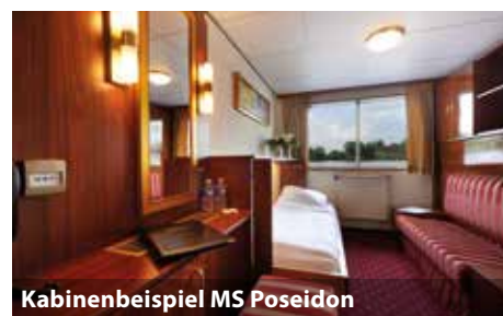
Kabinenbeispiel MS Poseidon

Die MS Poseidon ist ein komfortables Flusskreuzfahrtschiff. Die geschmackvolle Einrichtung und angenehme, lockere Atmosphäre sind die passenden Zutaten für einen herrlichen Urlaub an Bord von MS Poseidon. Die freundliche Crew des Schiffes unternimmt alles, um Ihre Zeit an Bord zu einer unvergesslichen Urlaubszeit zu machen. Selbstverständlich ist auch für Ihren vierbeinigen Begleiter bestens gesorgt und ein professioneller Hundetrainer an Bord.