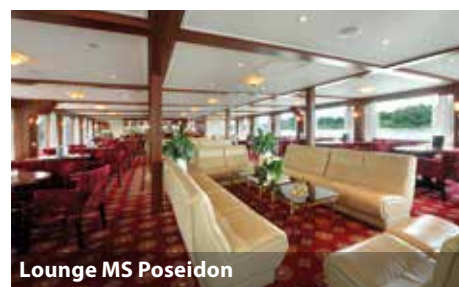
Lounge MS Poseidon

Die MS Poseidon ist ein komfortables Flusskreuzfahrtschiff. Die geschmackvolle Einrichtung und angenehme, lockere Atmosphäre sind die passenden Zutaten für einen herrlichen Urlaub an Bord von MS Poseidon. Die freundliche Crew des Schiffes unternimmt alles, um Ihre Zeit an Bord zu einer unvergesslichen Urlaubszeit zu machen. Selbstverständlich ist auch für Ihren vierbeinigen Begleiter bestens gesorgt und ein professioneller Hundetrainer an Bord.