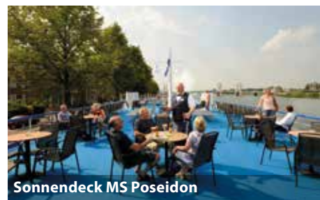
Sonnendeck MS Poseidon

Bitte beachten Sie, dass das Schiff aufgrund der Bauweise in Holland über steile Treppen verfügt und nicht barrierefrei ist.