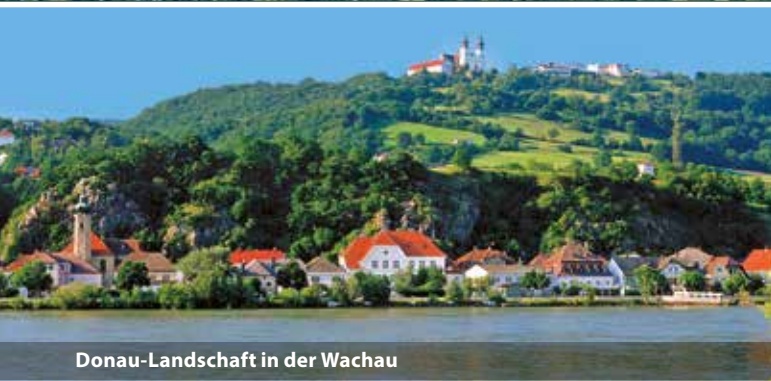
Donau-Landschaft in der Wachau