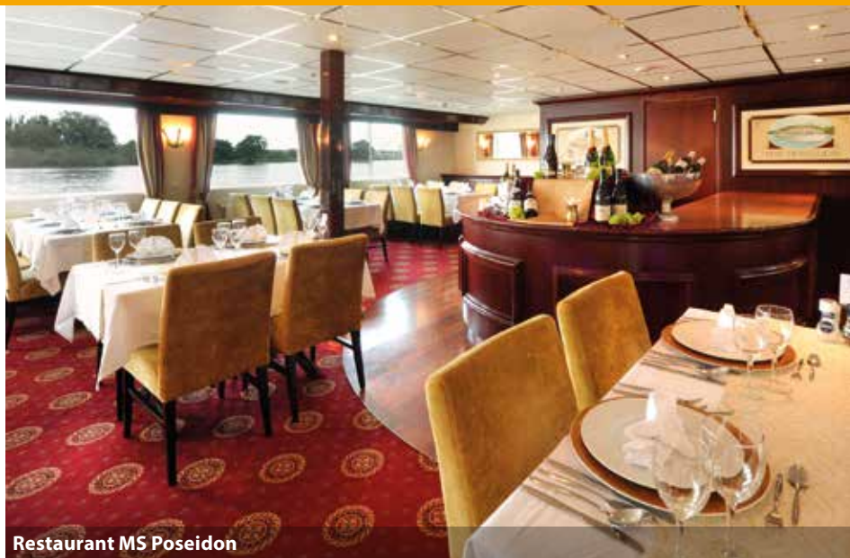
Restaurant MS Poseidon

➤ ALL INCLUSIVE-Verpflegung ➤ Hundewiese an Bord